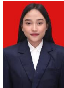
PUTRI RAMBUT PANJANG