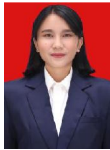
PUTRI RAMBUT SEBAHU